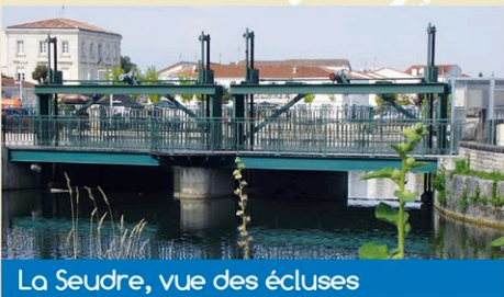
La Seudre, vue des écluses