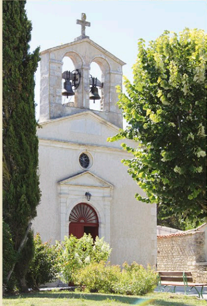
L'église de Le Chay