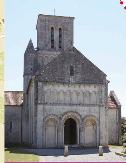
L'église de Corme-Ecluse