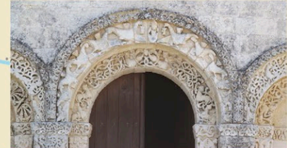
Tympan de l'église