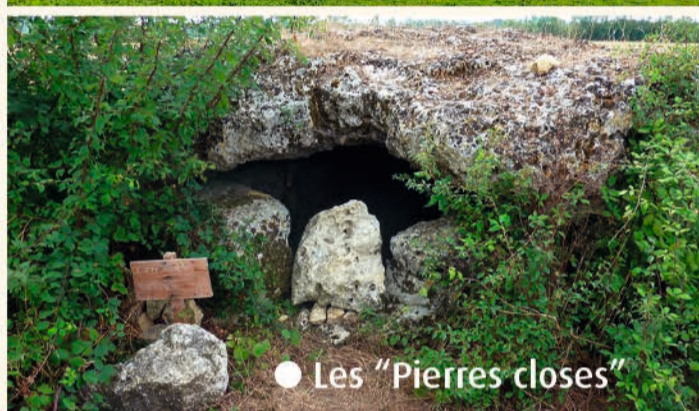
● Les "Pierres closes"

les maisons charentaises traditionnelles confèrent à Saint-Laurent-de-la-Prée un caractère de charme à deux pas de la mer. En effet, le centre bourg se prolonge vers la Charente au lieu-dit "les Roches" qui surplombe le marais et vers l'océan jusqu'à "Bois Madame" et "les Charmilles".