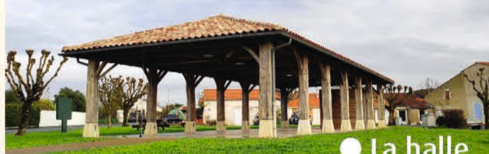
● La halle